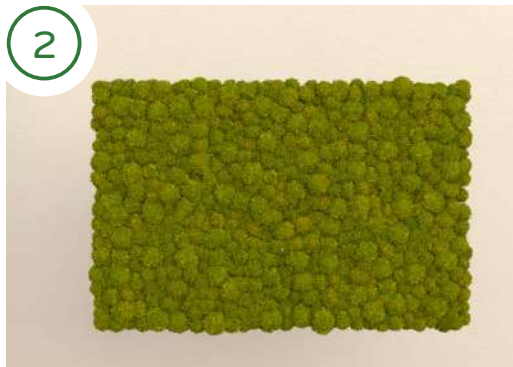
Prepara il primo pannello per l'installazione