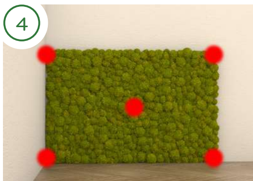
Posiziona il pannello come nella foto e le viti nei punti rossi