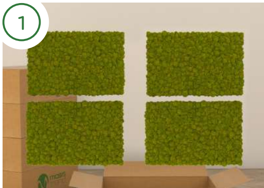
Estrai i pannelli dalla scatola