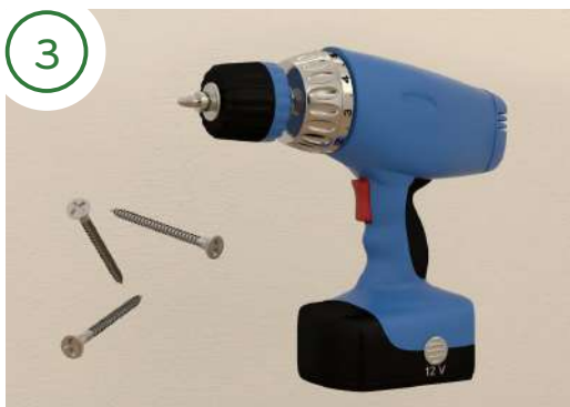
Se la parete è in cartongesso ti consigliamo di usare un avvitatore con delle normali viti