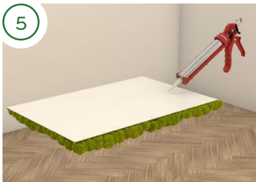
Se invece la parete è in muratura, usa del collante o silicone sul retro del pannello